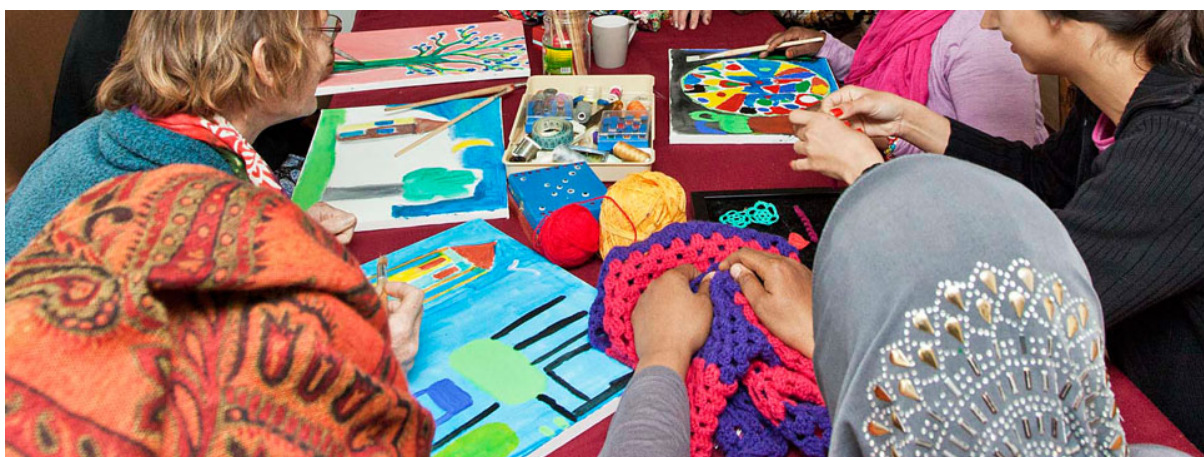
Lessen handvaardigheid in het Wereldvrouwenhuis