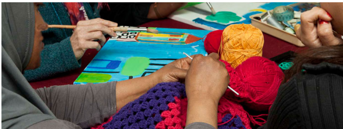
Lessen handvaardigheid in het Wereldvrouwenhuis