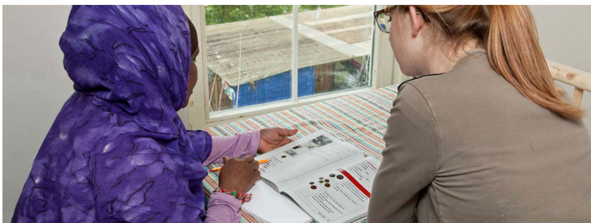
Taalles in het Wereldvrouwenhuis