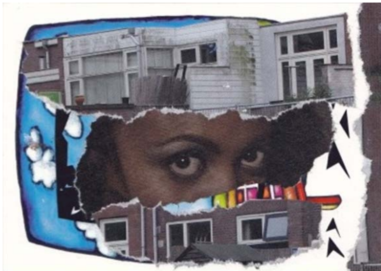
Kaart gemaakt tijdens de crea-workshop