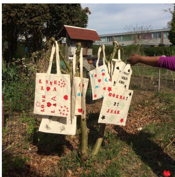
Tassen bedrukt bij handvaardigheid